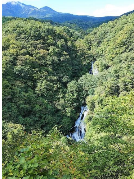
(↑霧降の滝と赤薙山・丸山)

耐えてノンストップでキスゲ平小休止後あと一息高度であと100六方沢橋へ着いた。六方沢に架かばは抜群だ。高原山方面の眺望がす復路は同じルートを戻りキスゲところ後輪がガタガタと音がした無事修理後、霧降の滝を観光して駐車場に戻った。下り側に勾配あり、部分的にきつい坂があった。