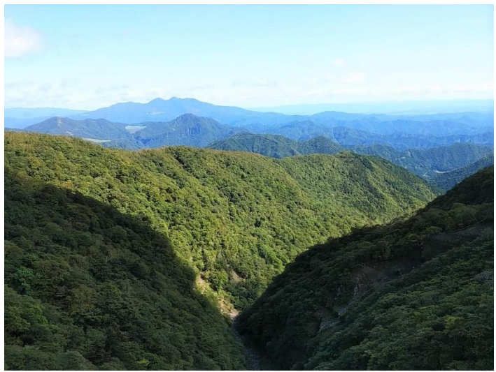
ゴールの六方沢橋より高原山方面を望む