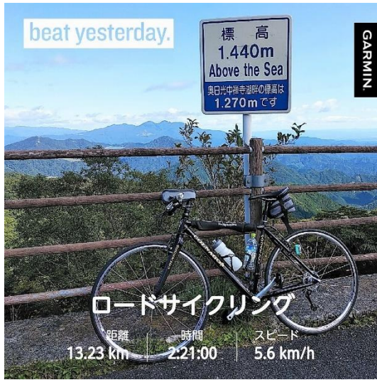
六方沢橋駐車場展望台より高原山を望む