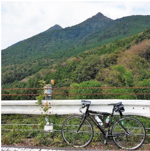
風返橋・富士見橋付近より筑波山

令和2年10月7日（水）晴のち曇 バイク：COLNAGO Impact 記：岩田