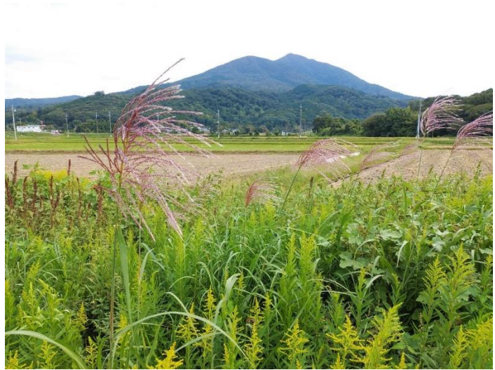
りんりんロードより秋の筑波山